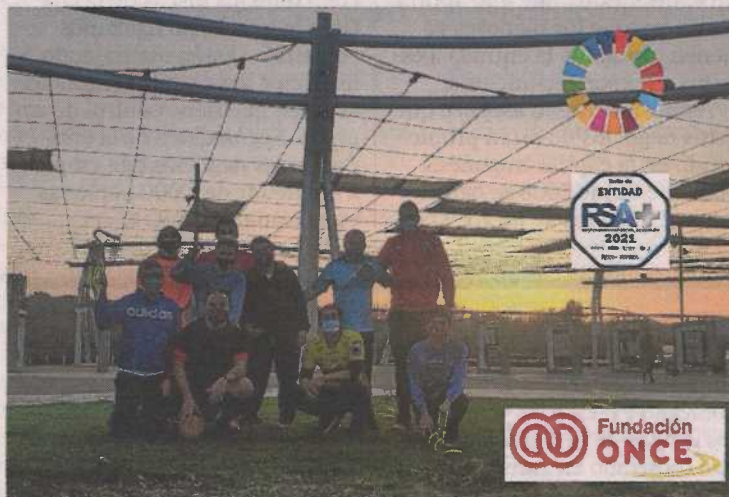
El equipo de Ser Más entrenaba en la Expo al quedarse sin campo. P.I.A.

Los Objetivos de Desarrollo Sostenible, más conocidos como los ODS, pretenden que el mun-