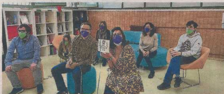
Componentes del Taller de Teatro, durante la gala 'online'.

Un vídeo de felicitación, una videollamada de celebración, y comunicados de enhorabuena de ida y vuelta, han circulado estos días entre toda la gran familia de personas usuarias, familiares, voluntariado y colaboradores que integran Fundación Cedes, entidad comprometida con las personas con discapacidad intelectual y del desarrollo, para celebrar que el Taller de Teatro de la fundación ha sido galardonado con el Premio Cuarto Pilar, concedido por el Instituto Aragonés de Servicios Sociales, en la cate-