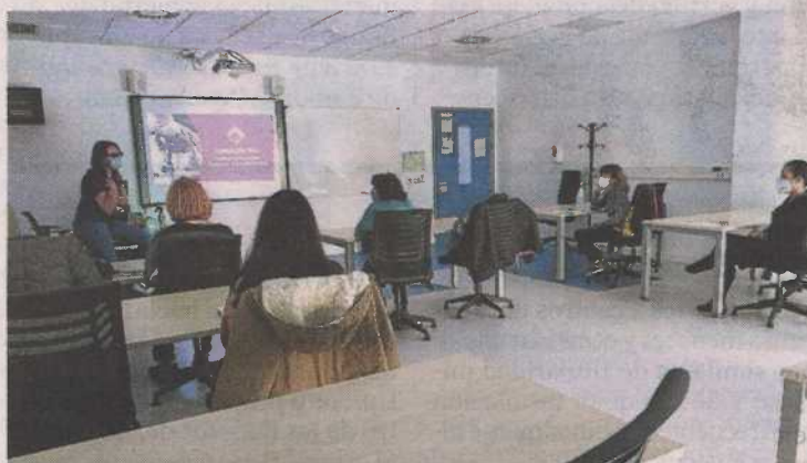
Las voluntarias del programa reciben formación en discapacidad y trato adecuado. FUNDACIÓN DFA

Ahora que las personas que viven en la Residencia Josemi Monserrate de Fundación DFA han concluido su proceso de vacunación es momento de retomar las actividades que quedaron suspendidas por la pandemia. Uno de los programas que va a dar a comien-